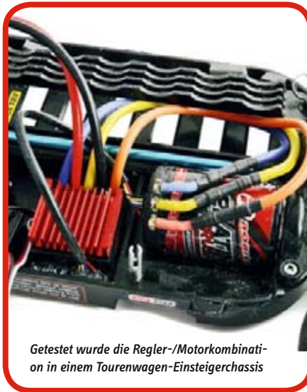
Getestet wurde die Regler-/Motorkombination in einem Tourenwagen-Einsteigerchassis

Um nun Regler und Motor verwenden zu können, bedarf es noch einiger Arbeit. Ich habe zuerst am Motor 2-3 cm lange Kabel und 3,5 mm Goldkontaktstecker angelötet und mit Schrumpfschlauch isoliert. Auf der Reglerseite sind dann passende Goldkontaktbuchsen angelötet und auch isoliert worden und zwei 4 mm Stecker für meine Lipoakkus. Die Steckverbindung zwischen Motor und Regler halte ich für sehr praktisch, wenn man mal den Motor wechseln will, oder den Regler in einem anderen Fahrzeug verwenden mag. Man spart sich die Arbeit des Lötens und natürlich auch das Geld für einen zweiten Regler. Vor der Verwendung des Reglers sollte in jedem Fall die Akkueinstellung kontrolliert werden!