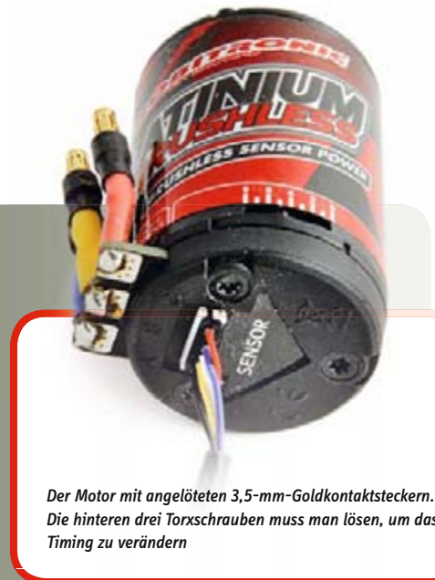
Der Motor mit angelöteten 3,5-mm-Goldkontaktsteckern. Die hinteren drei Torxschrauben muss man lösen, um das Timing zu verändern

Der Speedstar Brushless ist durchaus ein Regler, den man sogar in einer Stockklasse einsetzen könnte oder bei Vereinsrennen. Vor allem beim Motor sollte man aber lieber mit einem, der nicht zu viel Drehzahl produziert, anfangen. Das Chassis wird es einem danken, schließlich will man nicht immer wieder Ersatzteile kaufen müssen, die vom Motor regelmäßig zerlegt werden. Das mir vorliegende Set hat schon recht viel Feuer. Um sich selbst etwas zu beschränken, kann der Regler so eingestellt