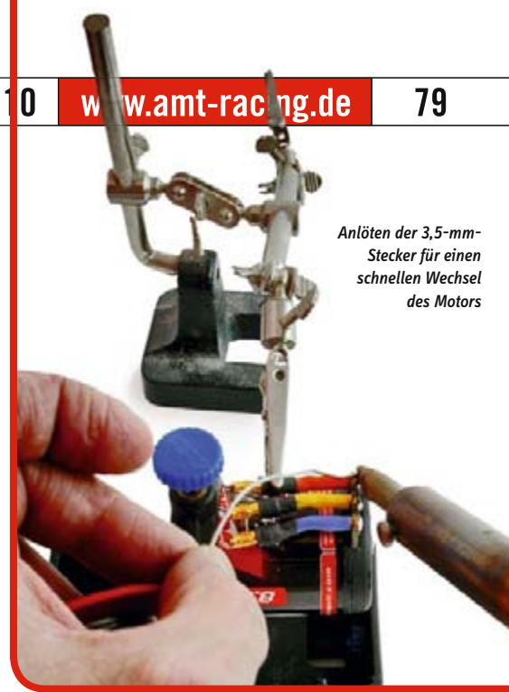
Anlöten der 3,5-mm-Stecker für einen schnellen Wechsel des Motors