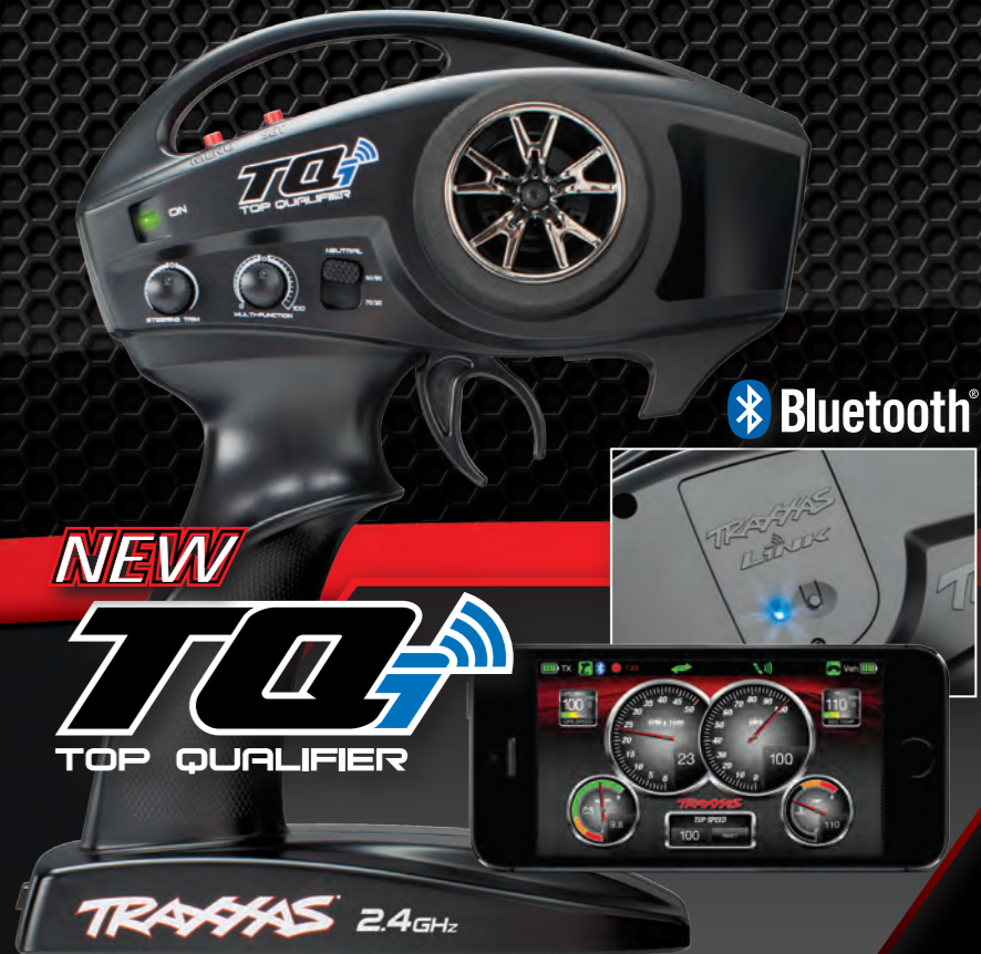
NEW TQi TOP QUALIFIER TRAXXAS 2.4GHz TQi RADIO SYSTEM WITH TRAXXAS LINK WIRELESS MODULE*