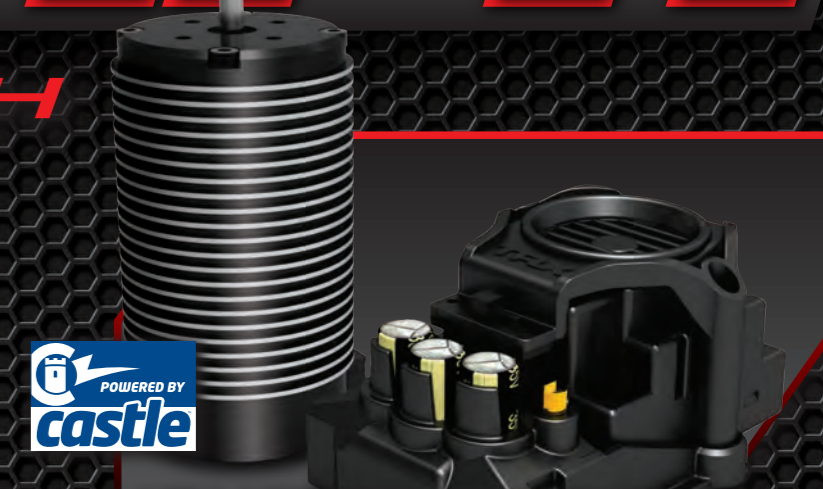
POWERED BY castle CASTLE MAMBA MONSTER EXTREME BRUSHLESS POWER SYSTEM