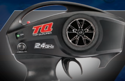
TQ™ 2.4GHz Radio System