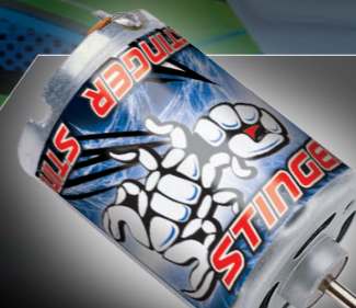
Watercooled Stinger 20-Turn Electronic Motor