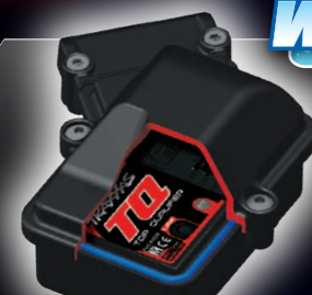
Waterproof Receiver Box