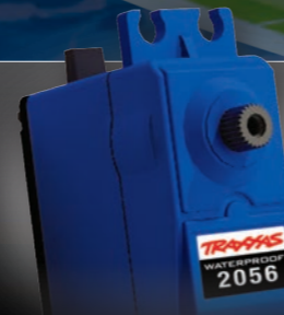
High-Torque Waterproof Servo