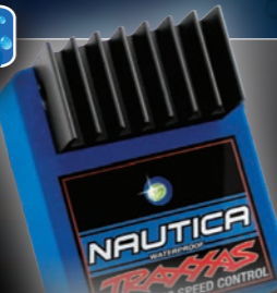
Nautica Electronic Speed Control